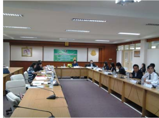
คณะกรรมการประเมินฯ พบผู้บริหารวิทยาเขตเฉลิมพระเกียรติ จังหวัดสกลนคร