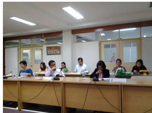
คณะกรรมการประเมินฯ รายงานผลการประเมินฯ ให้ผู้บริหาร และบุคลากรของวิทยาเขตฯ รับทราบ