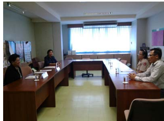
คณะกรรมการประเมินฯ สัมภาษณ์ผู้มีส่วนได้ส่วนเสียของวิทยาเขตฯ