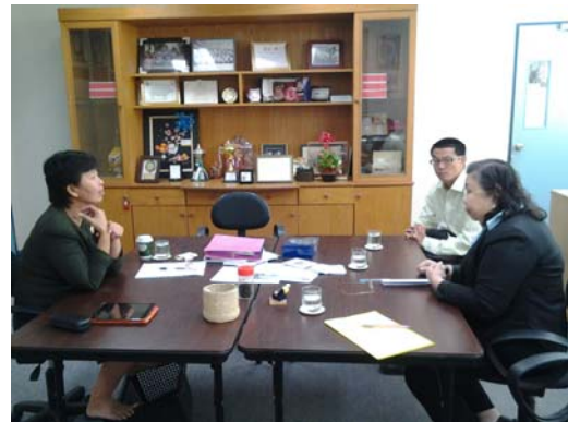
คณะกรรมการประเมินฯ พิจารณาเอกสารหลักฐาน และเยี่ยมชมส่วนงาน