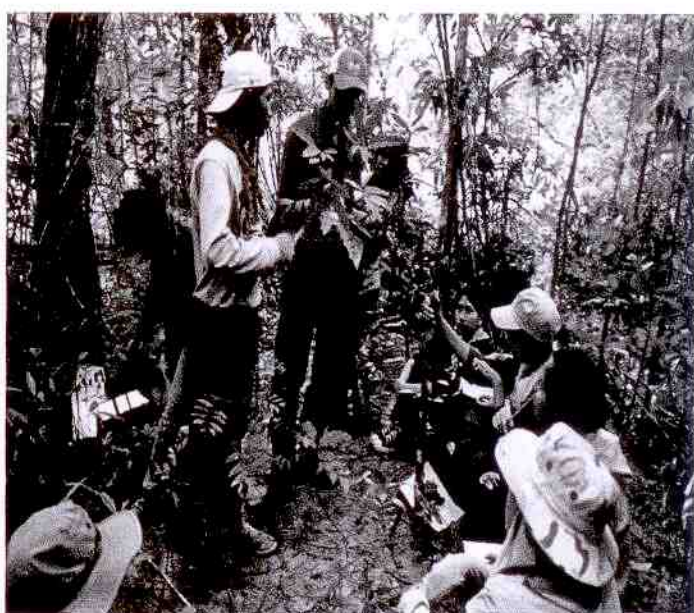
กิจกรรมเรียนรู้ต้นไม้ในป่าใหญ่