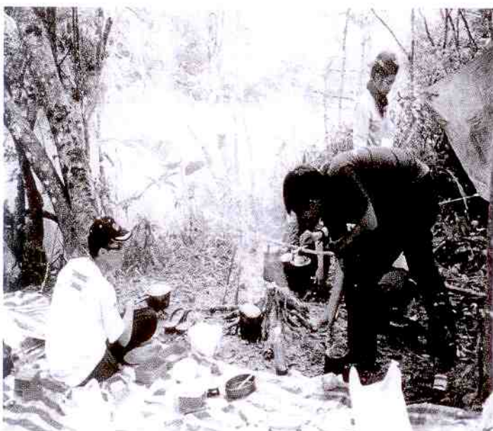
กิจกรรมการดำรงชีพในป่า