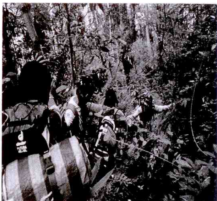
กิจกรรมเดินป่าศึกษาธรรมชาติ